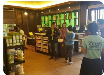
งานสร้างสรรค์: ออกแบบร้าน OTOP “ลุ่มเลียวเล็ง” OTOP STORE DESIGN “LIM LEAK SENG”