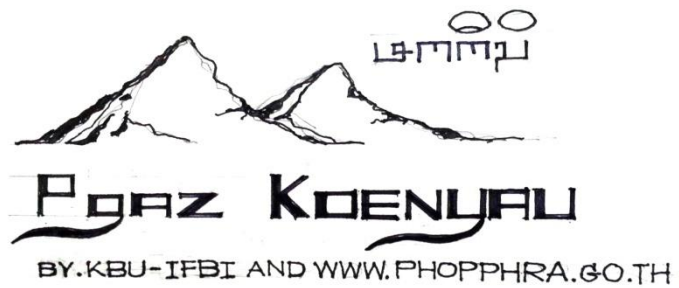
ออกแบบตราสัญลักษณ์เสื้อ “ปกากะญอ” LOGO DESIGN OF T-SHIRT “PGAZ KOENYAU”