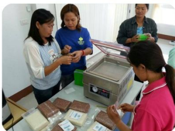
ออกแบบและพัฒนาตราสัญลักษณ์และภาชนะบรรจุข้าว “บ้านวังศิลา” DESIGN AND DEVELOPMENT LOGO AND PACKAGING OF RICE “BAAN WANG SILA”